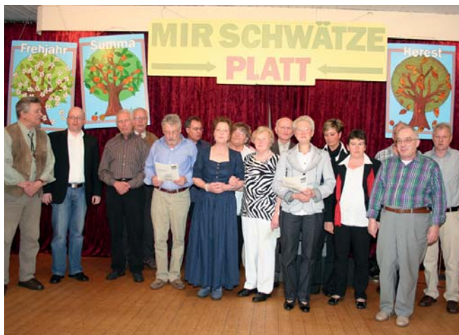
„Mir schwätze Platt“ heist es für die Mitglieder der Mundart-Initiative rund ums ganze Jahr.